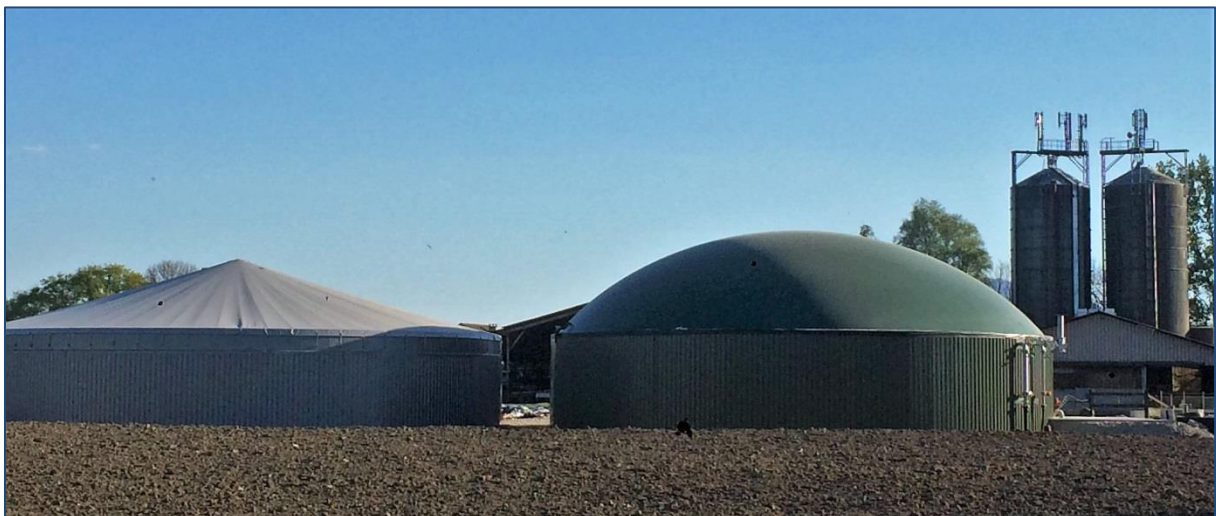
Unité de méthanisation de la SAS MEUHVELEC à VEIGY-FONCENEX (74)

Documents relatifs à la prorogation de la durée de l'enquête publique